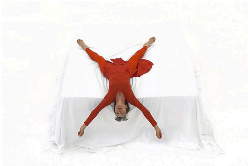
Rubedo